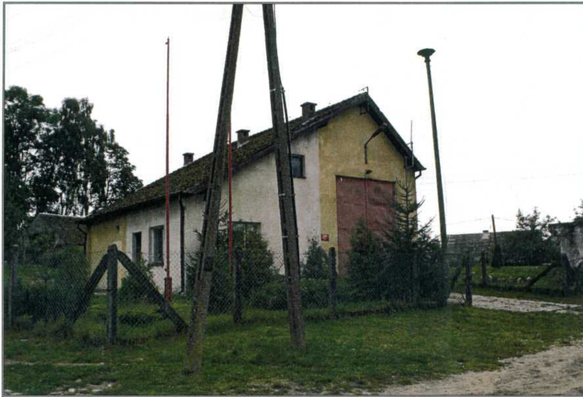
zdj.3. Remiza Strażacka (siedziba Ochotniczej Straży Pożarnej) w Rydzewie.

Warto wspomnieć, że od skuteczności kierunków promocji poprzez kulturę pojedynczych miejscowości, zależy powodzenie promocji całej gminy. Tego rodzaju ośrodek ma również duże szanse na pozyskiwanie środków finansowych ze źródeł zewnętrznych. Kreatywne funkcje kultury wsparte odpowiednią promocją służą rozwojowi i są bazą, na której budowany jest prestiż i zaplecze finansowe dla przedsięwzięć kulturalnych.