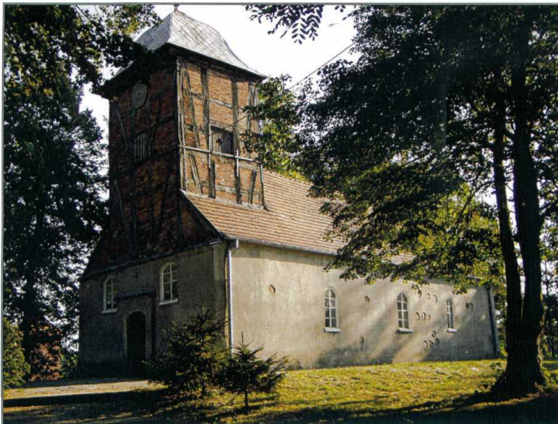
zdj.2. Kościół pw. Trójcy Świętej, bud. XVI w., gotyk, pośw. 1945.

Sołectwo Rydzewo położone jest w północnej części gminy Drawsko Pomorskie zajmuje powierzchnię 1197ha, na terenie sołectwa zamieszkuje 455 osób. Miejscowość położona nad dwoma atrakcyjnymi jeziorami j. Rydzewo o pow. 42,50ha i j. Bęgardowo o pow. 30,00ha aktualnie dzierżawione przez PGR-ryb Złocieniec.