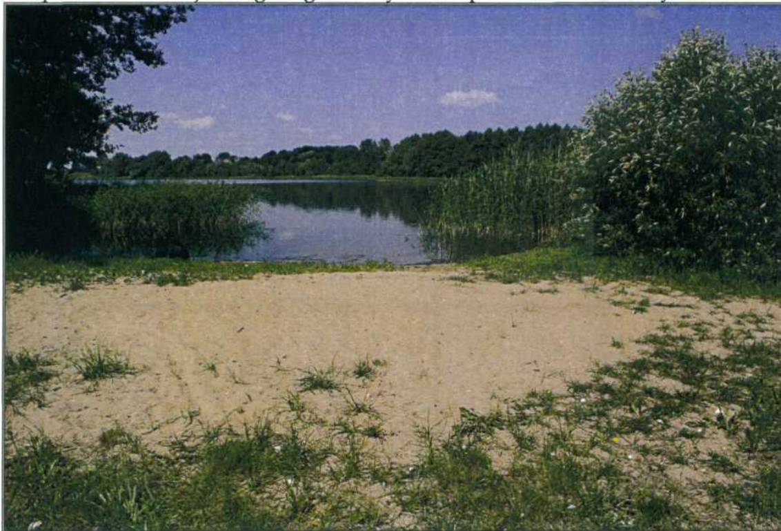
zdj.4. Kąpielisko wiejskie w Rydzewie.

Niewątpliwie turystyka jest tym rodzajem działalności, która bazuje na zasobach naturalnych. Na obszarach cennych przyrodniczo turystyka stymulować może i powinna rozwój danego regionu. Rydzewo posiada takie walory.