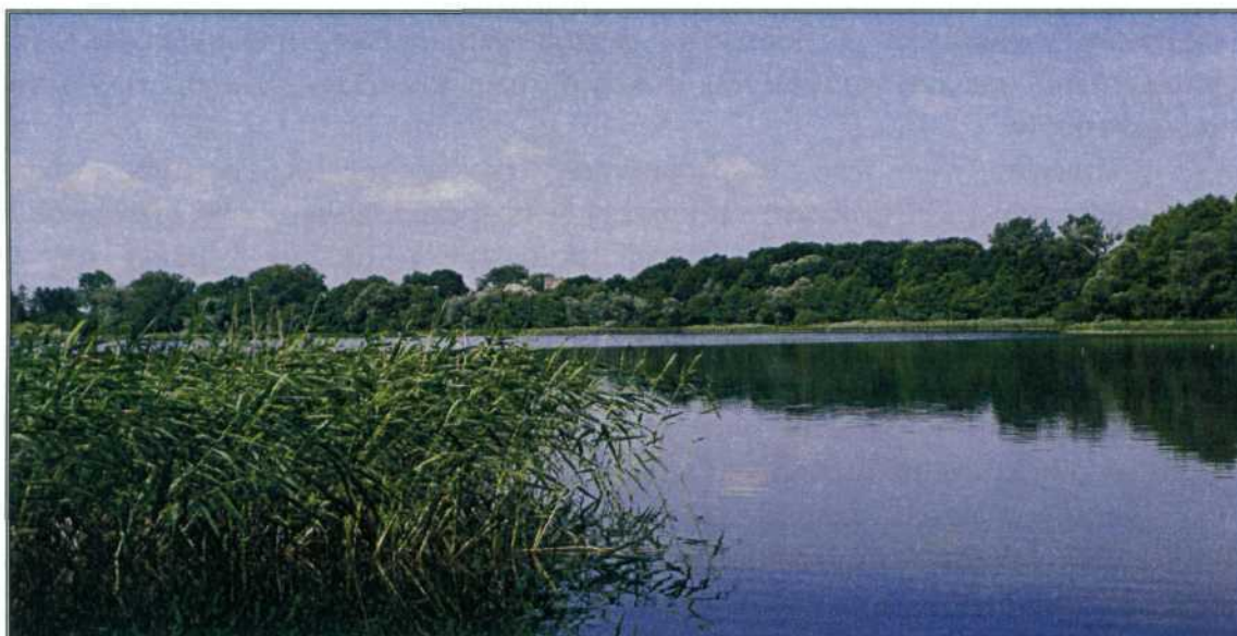
zdj.1. Jezioro Bęgardowo w Rydzewie.