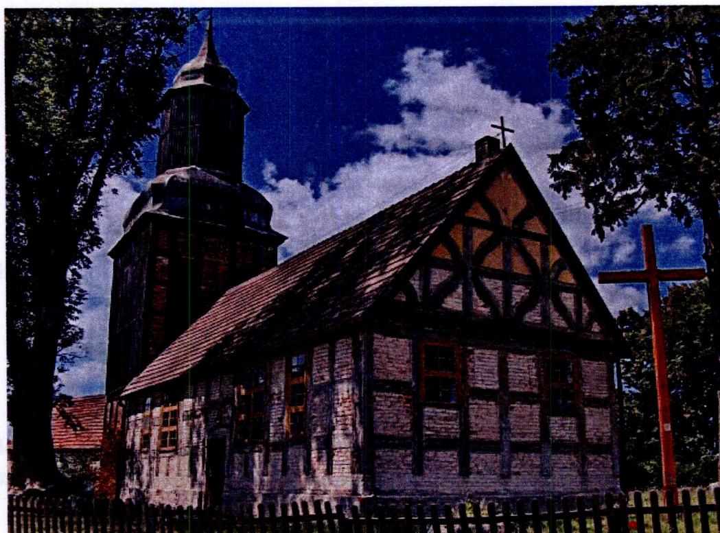
Kościół pw. MB Królowej Polski z 1662 r.