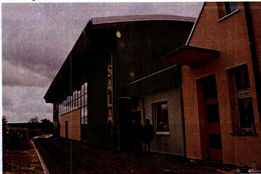
Sala sportowa w Mielenku Drawskim

Funkcje rekreacyjne dla mieszkańców Mielenko Drawskiego spełniają piękne okoliczne lasy oraz zbiorniki wodne oddalone o ok. 1,5-2 km. Korzystanie z nich jest jednak utrudnione, ze względu, iż leżą one na terenie poligonu drawskiego. Przez miejscowość przebiega także rowerowy pomarańczowy szlak turystyczny, a w pobliżu szlak kajakowy im. Ks. Kardynała Karola Wojtyły. W miejscowości znajduje się także boisko sportowe oraz hala sportowa.