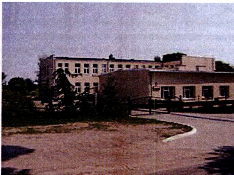
Szkoła Podstwiwowa w Mielenku Drawskim

Uczniowie w wieku gimnazjalnym uczęszczają do Gimnazjum im. Adama Mickiewicza w Drawsku Pomorskim, do którego dojeżdżają bezpłatnie autobusami PKS. Natomiast w wieku późniejszym wybierają szkoły średnie i zawodowe głównie w Drawsku Pomorskim, sporadycznie w Kaliszu Pomorskim. We wsi niewiele osób studiuje. Przeważnie jest to tryb niestacjonarny. Ośrodkami, w których kształcą się mieszkańcy są Szczecin, Koszalin oraz Poznań.