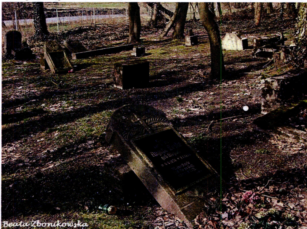
Cmentarz ewangelicki w Mielenku Drawskim