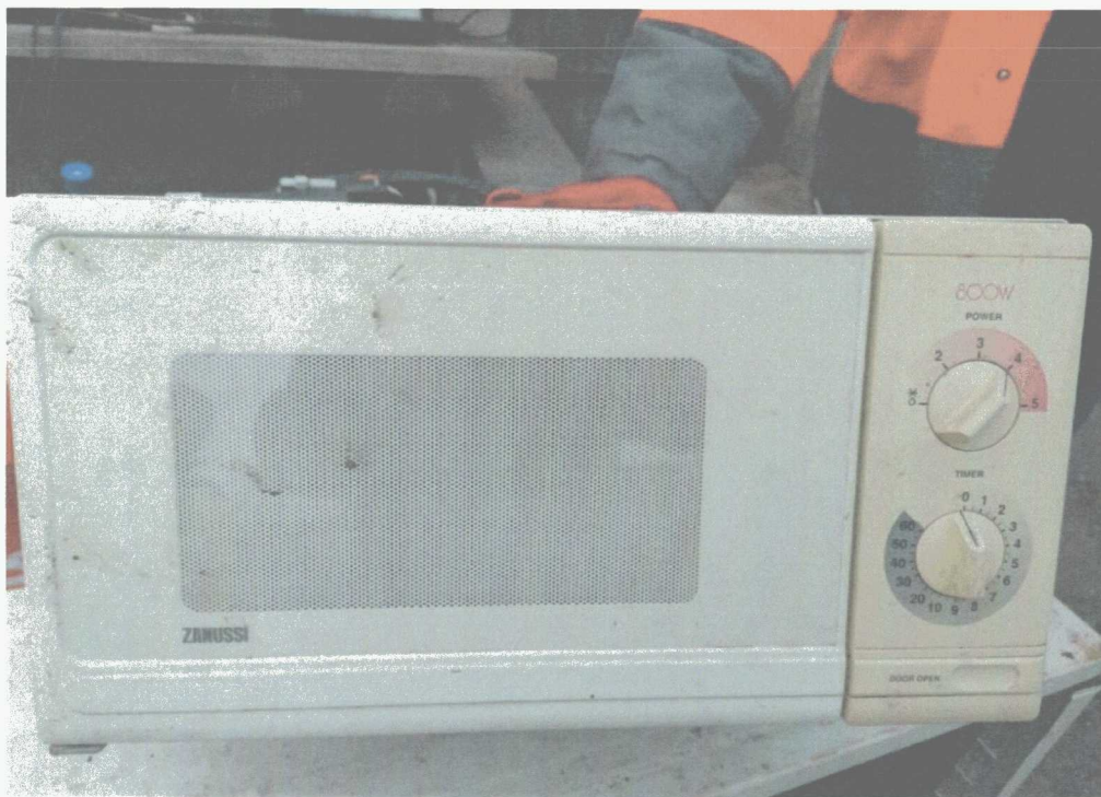
Poz. 9 KUCHENKA MIKROFALOWA