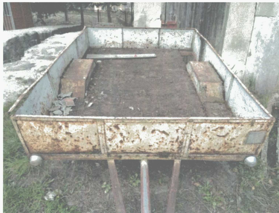
Poz. 13 PRZYCZEPKA SAMOCHODOWA