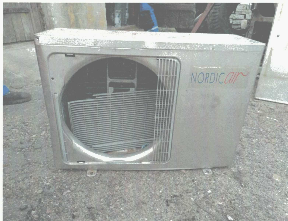
Poz. 2 KLIMATYZATOR NORDIC