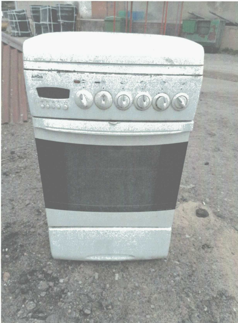
Poz. 3 PIEC GAZOWY 5 PALNIKOWY