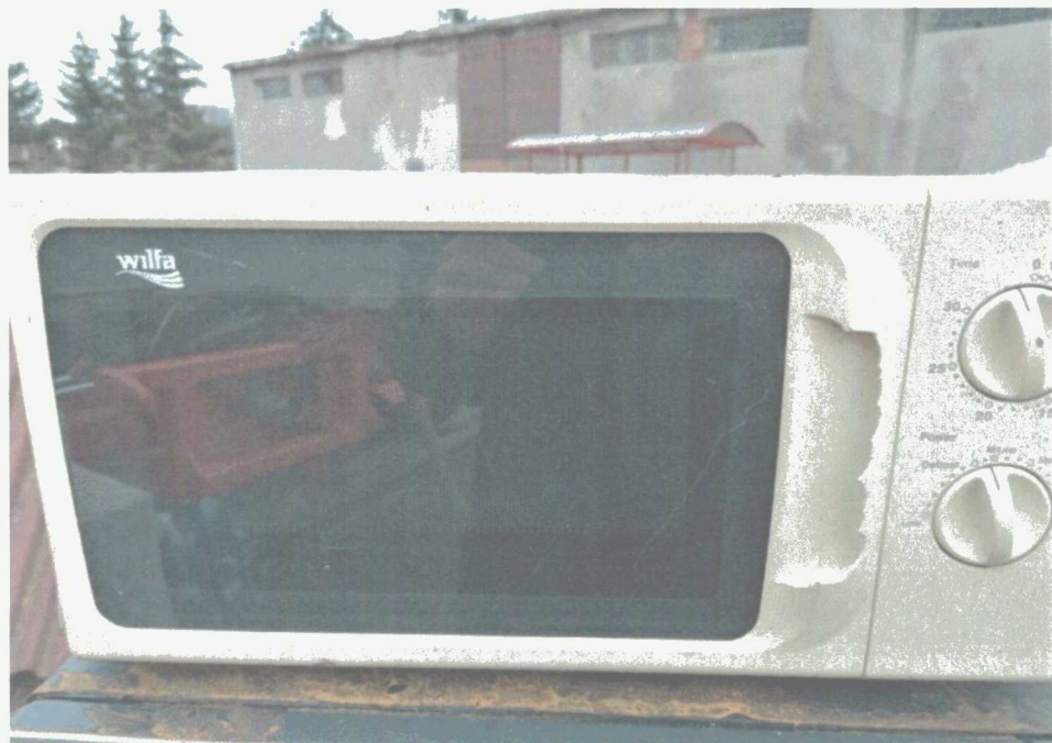
Poz. 7 KUCHENKA MIKROFALOWA