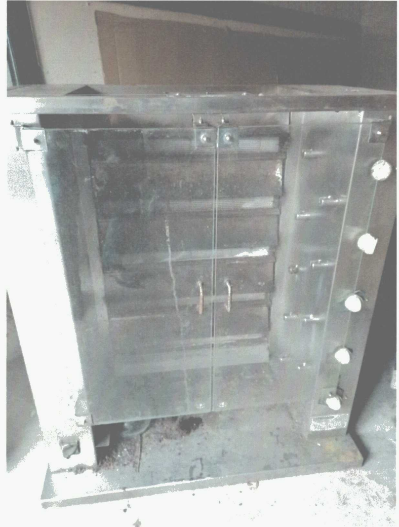
Poz. 12 ROŻEN DO PIECZENIA DROBIU