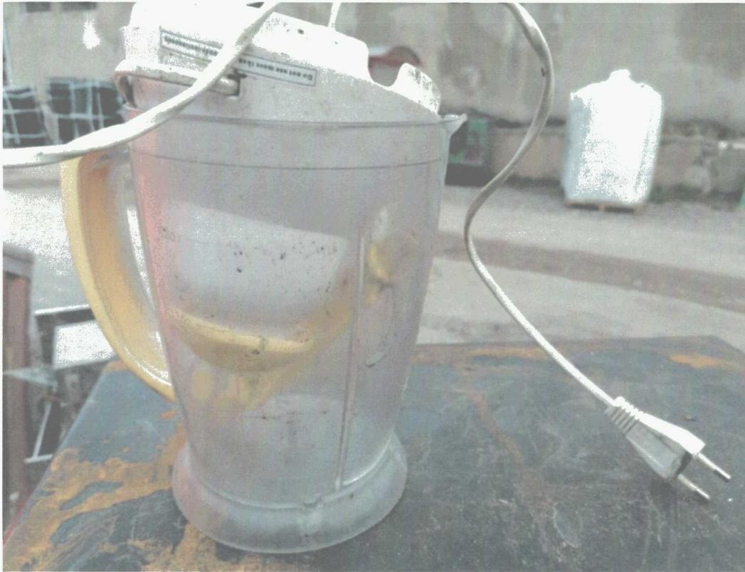
Poz. 11 MIESZAŁKA DO CIASTA