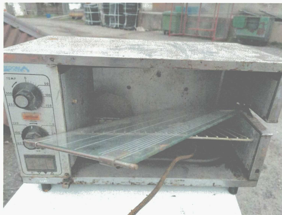
Poz. 10 PIEC DO PIECZENIA ZAPIEKANEK