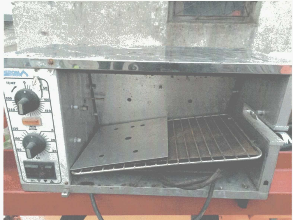
Poz. 4 PIEC DO PIECZENIA POTRAW TYPU KEBAB