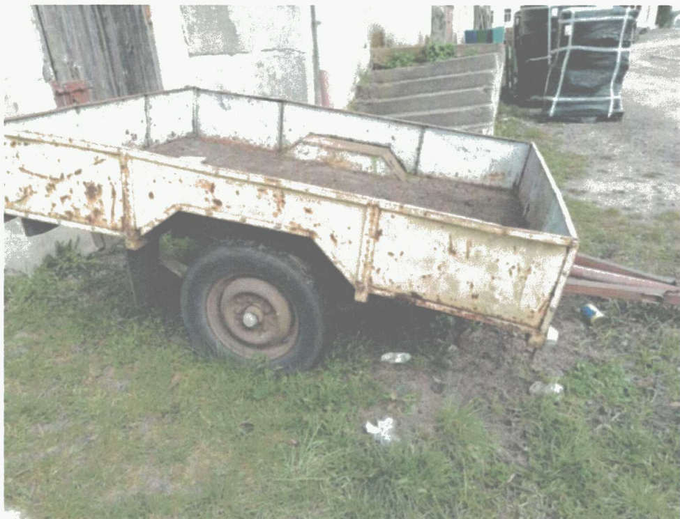
Poz. 13 PRZYCZEPKA SAMOCHODOWA