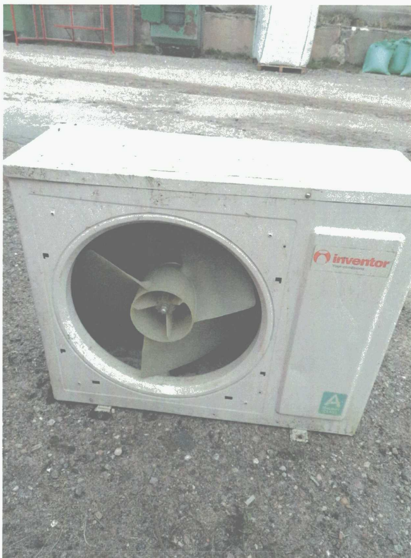
Poz. 1 KLIMATYZATOR INWENTOR