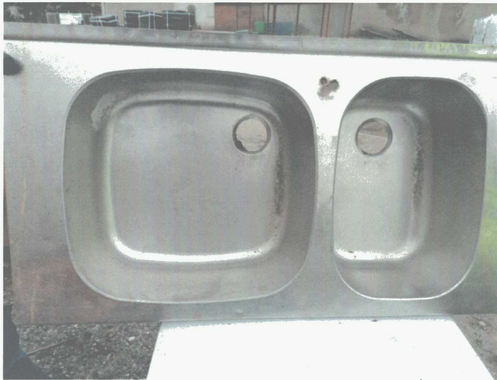
Poz. 5 ZLEW DWUKOMOROWY