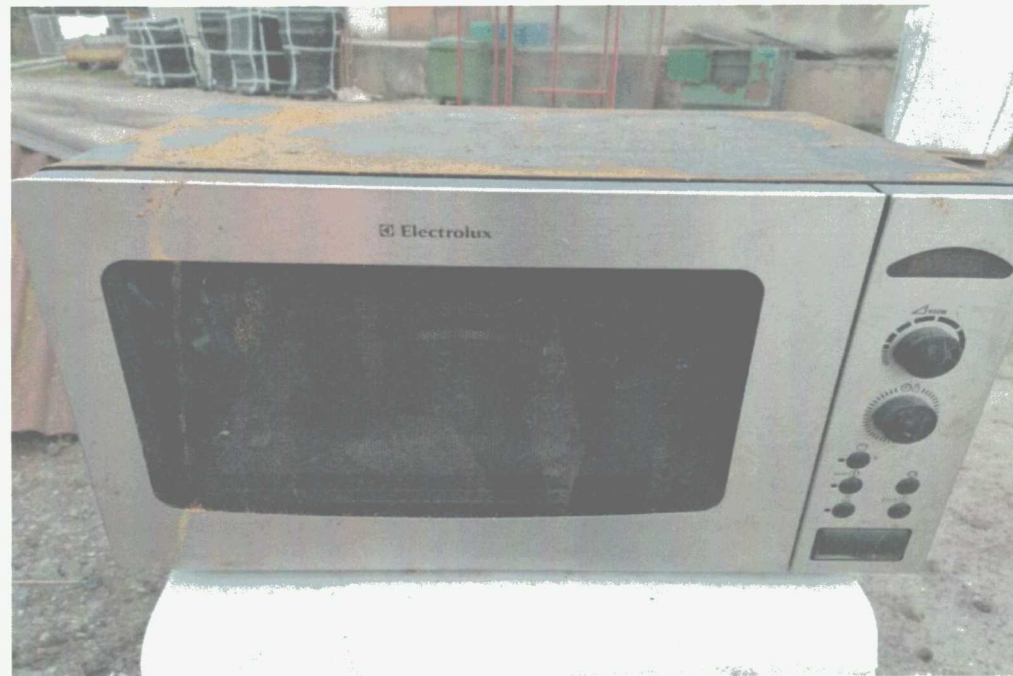
Poz. 8 KUCHENKA MIKROFALOWA