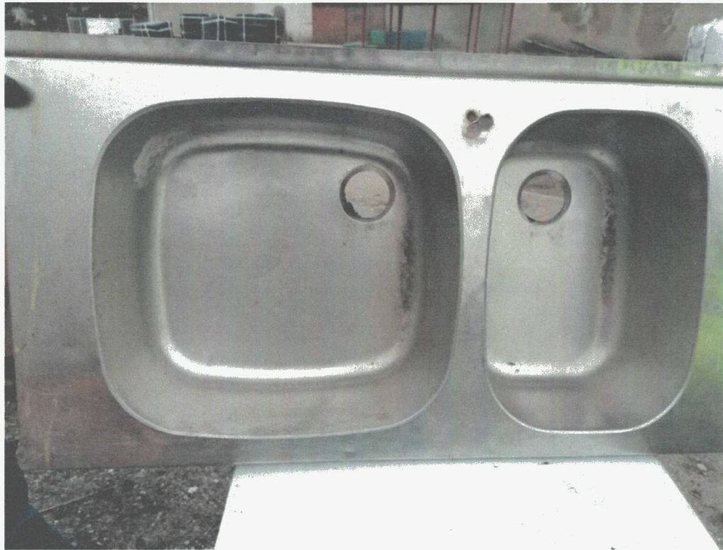
Poz. 5 ZLEW DWUKOMOROWY