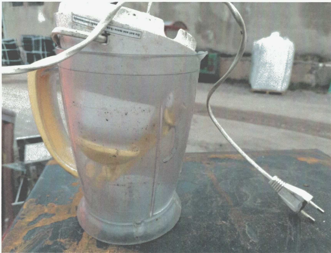
Poz. 11 MIESZALKA DO CIASTA