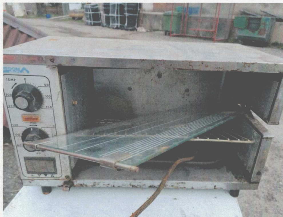
Poz. 10 PIEC DO PIECZENIA ZAPIEKANEK