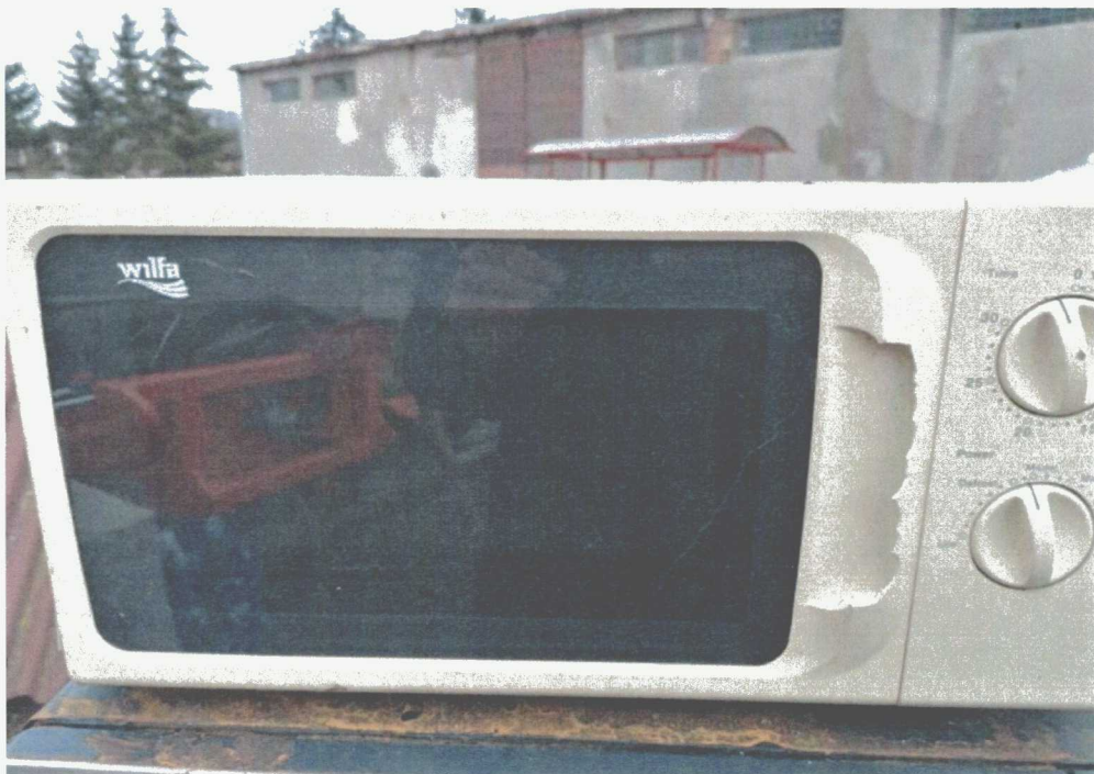
Poz. 7 KUCHENKA MIKROFALOWA