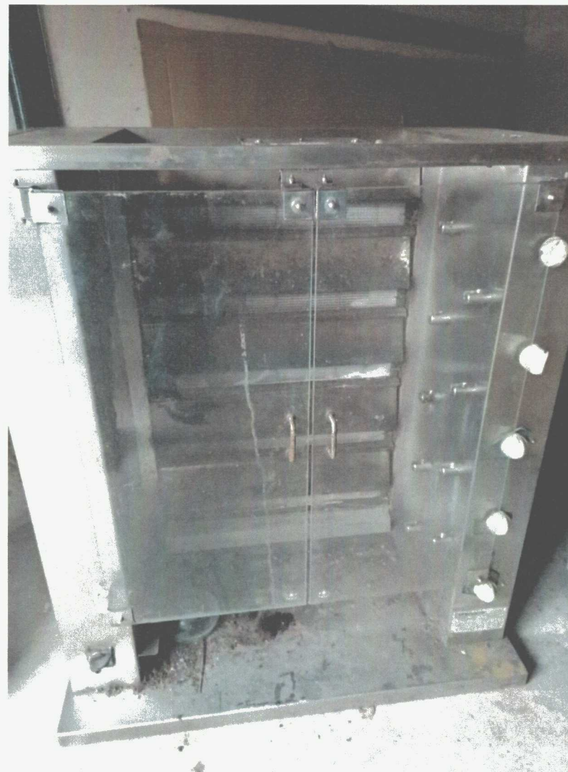
Poz. 12 ROŻEN DO PIECZENIA DROBIU