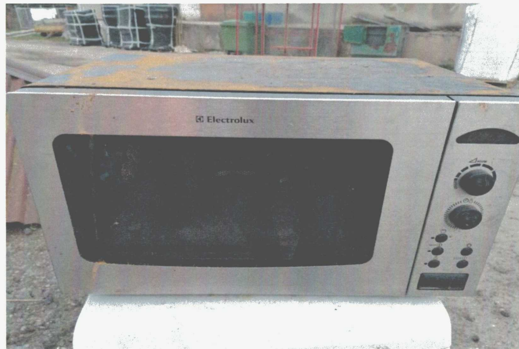
Poz. 8 KUCHENKA MIKROFALOWA