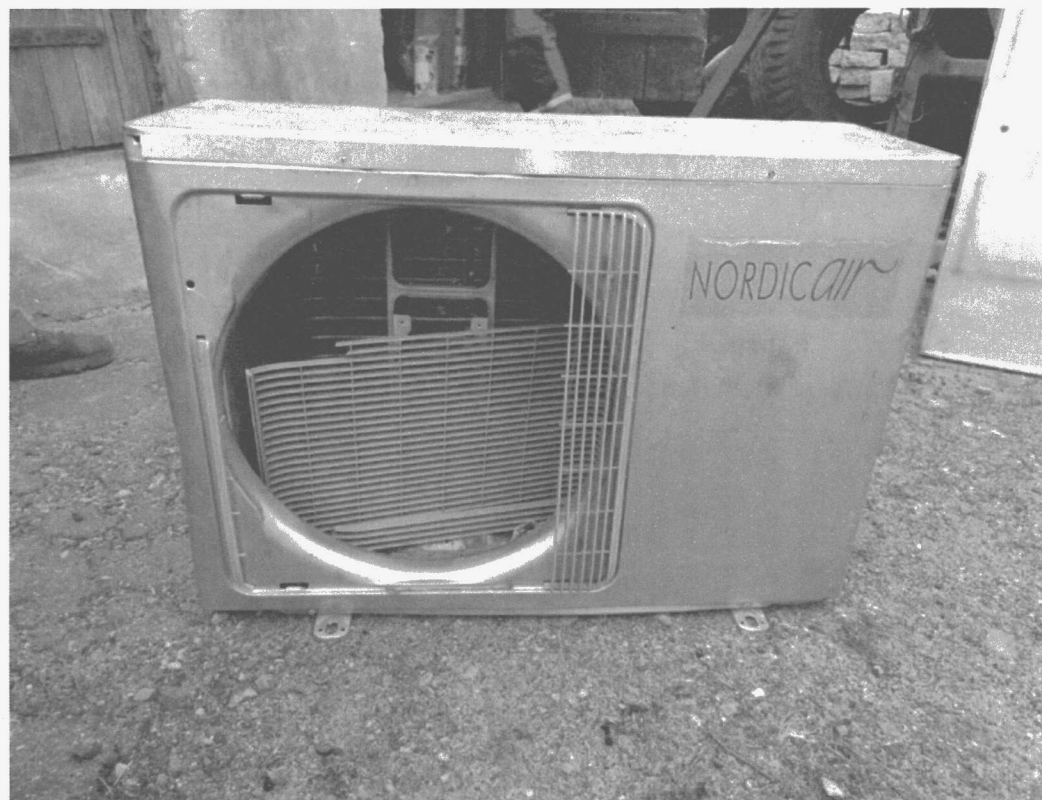
Poz. 2 KLIMATYZATOR NORDIC