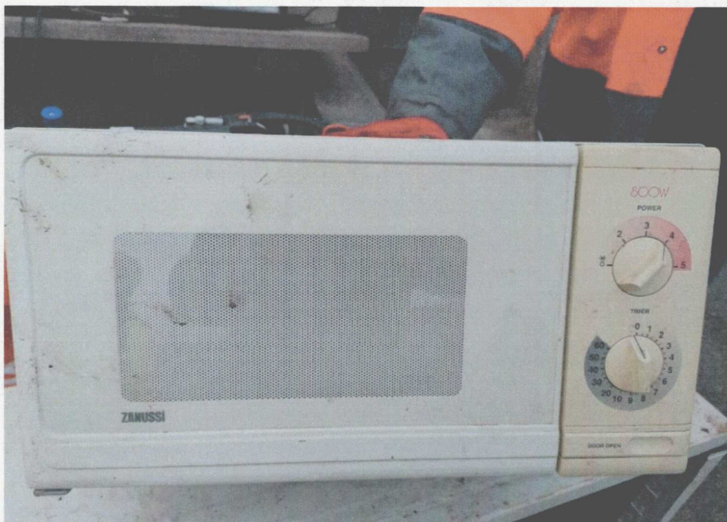
Poz. 9 KUCHENKA MIKROFALOWA