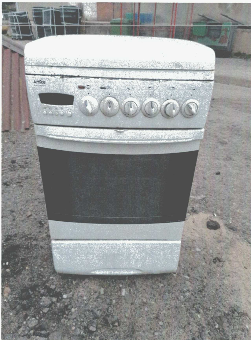
Poz. 3 PIEC GAZOWY 5 PALNIKOWY