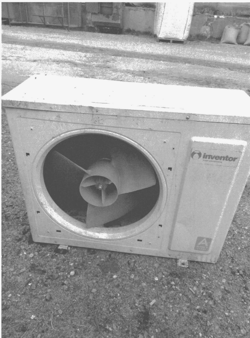
Poz. 1 KLIMATYZATOR INWENTOR