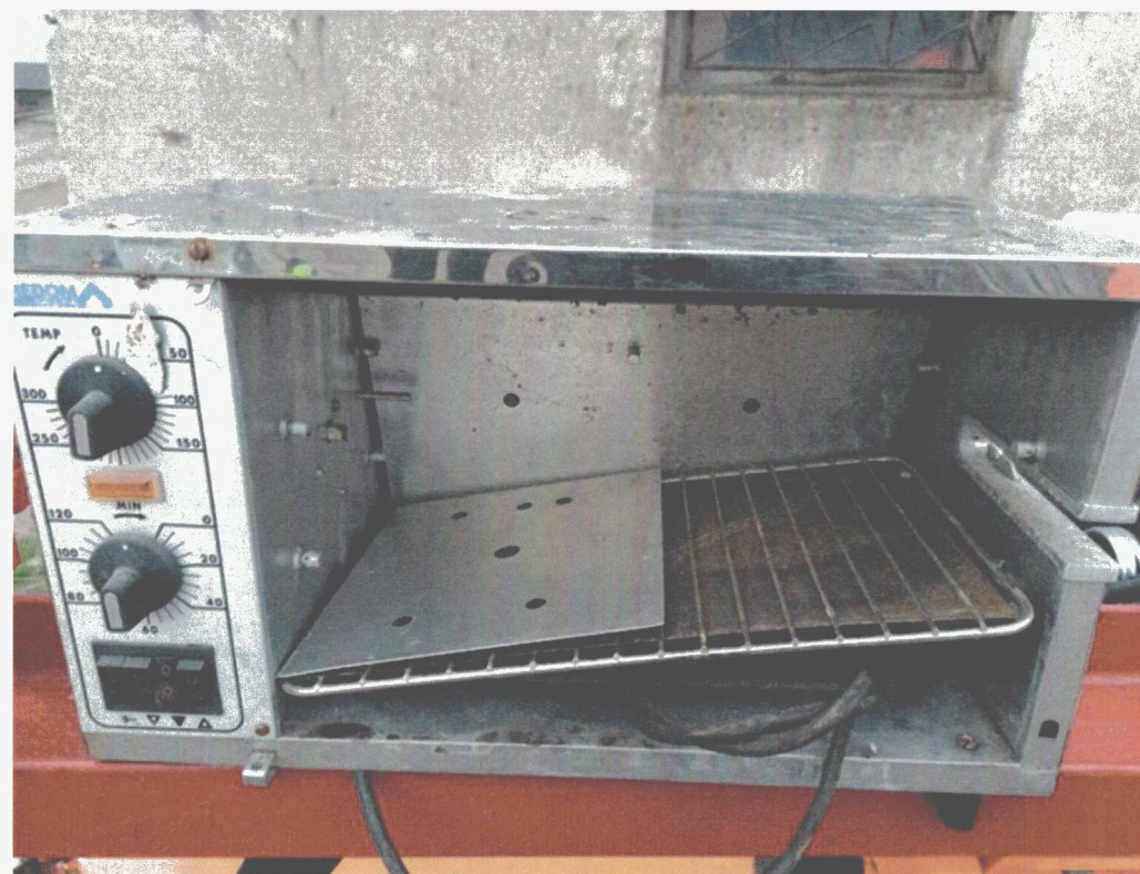
Poz. 4 PIEC DO PIECZENIA POTRAW TYPU KEBAB