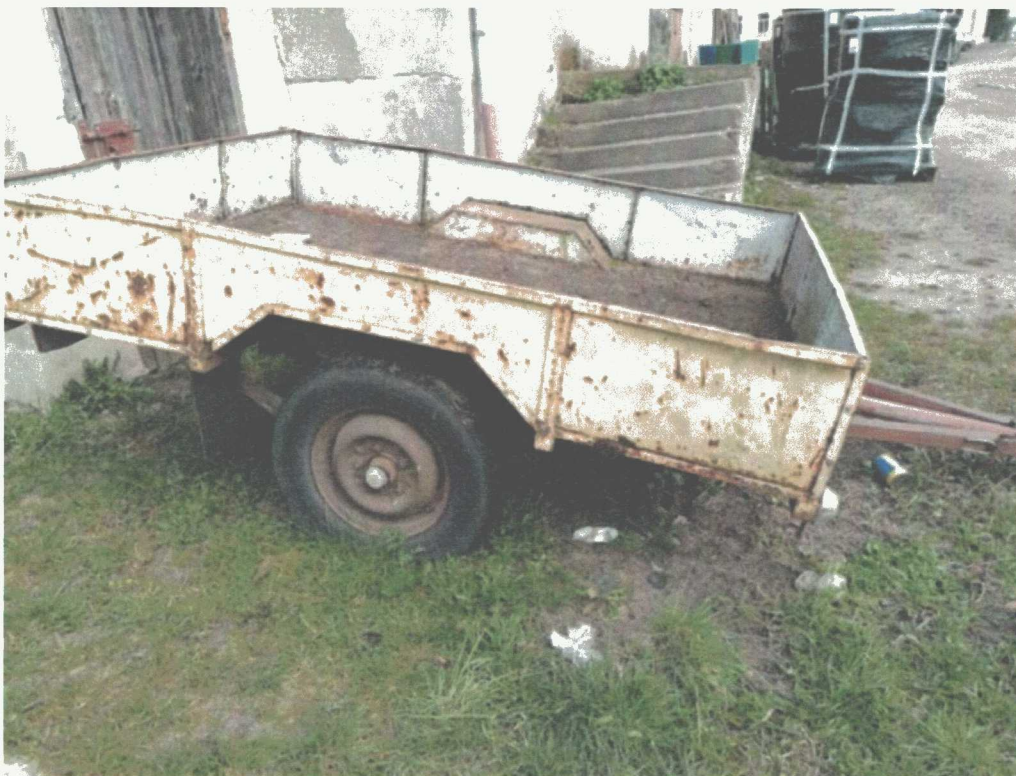
Poz. 13 PRZYCZEPKA SAMOCHODOWA