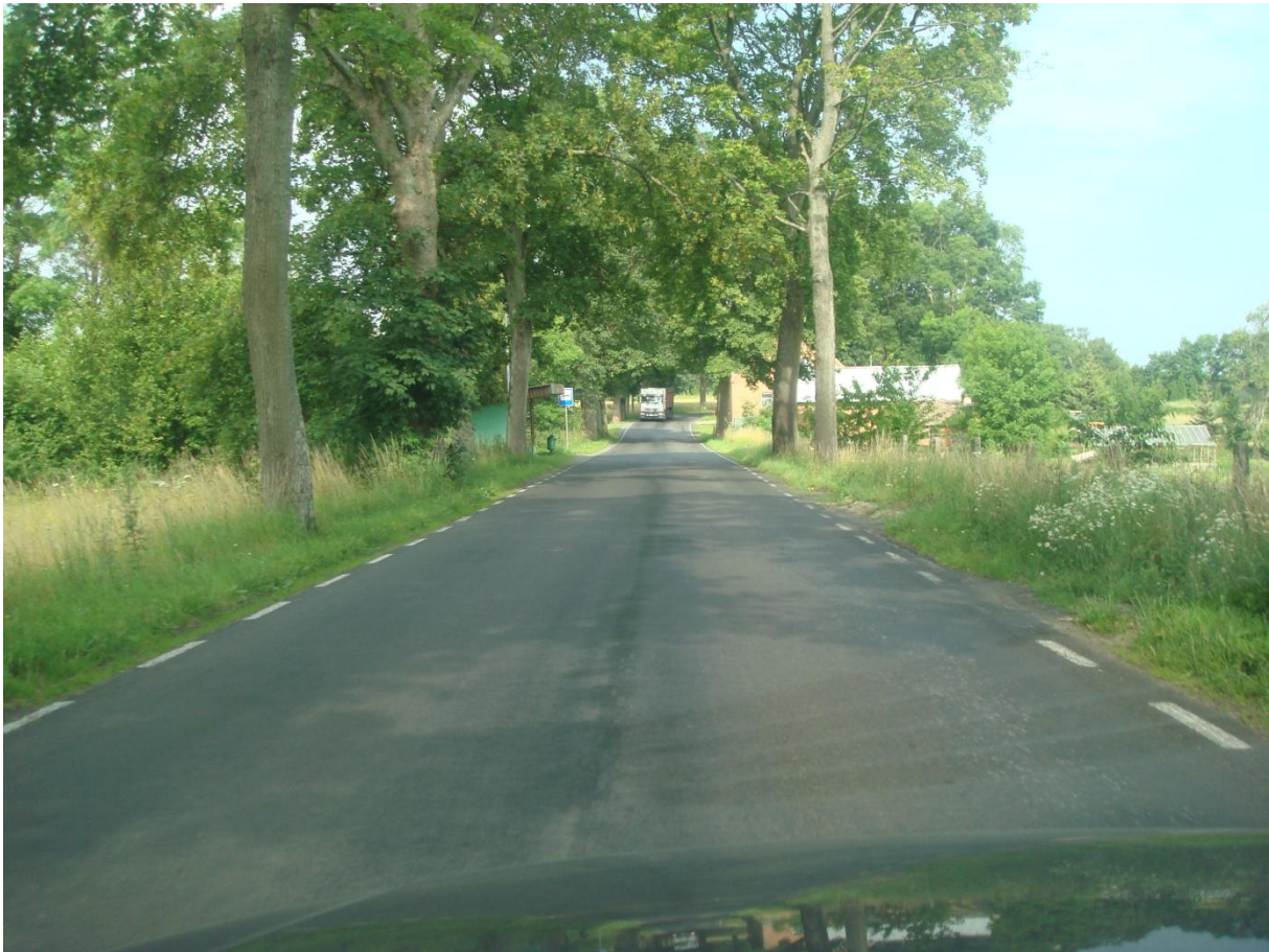
Fot. 30. Brak oświetlenia drogi na odcinku przez miejscowość Zagozd.