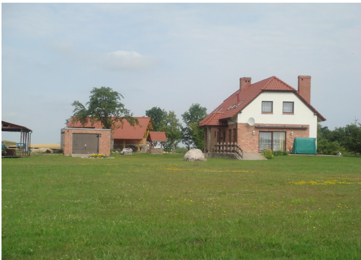
Fot. 9,10. Gospodarstwo agroturystyczne p. Orzechowskich w miejscowości Zagózd.