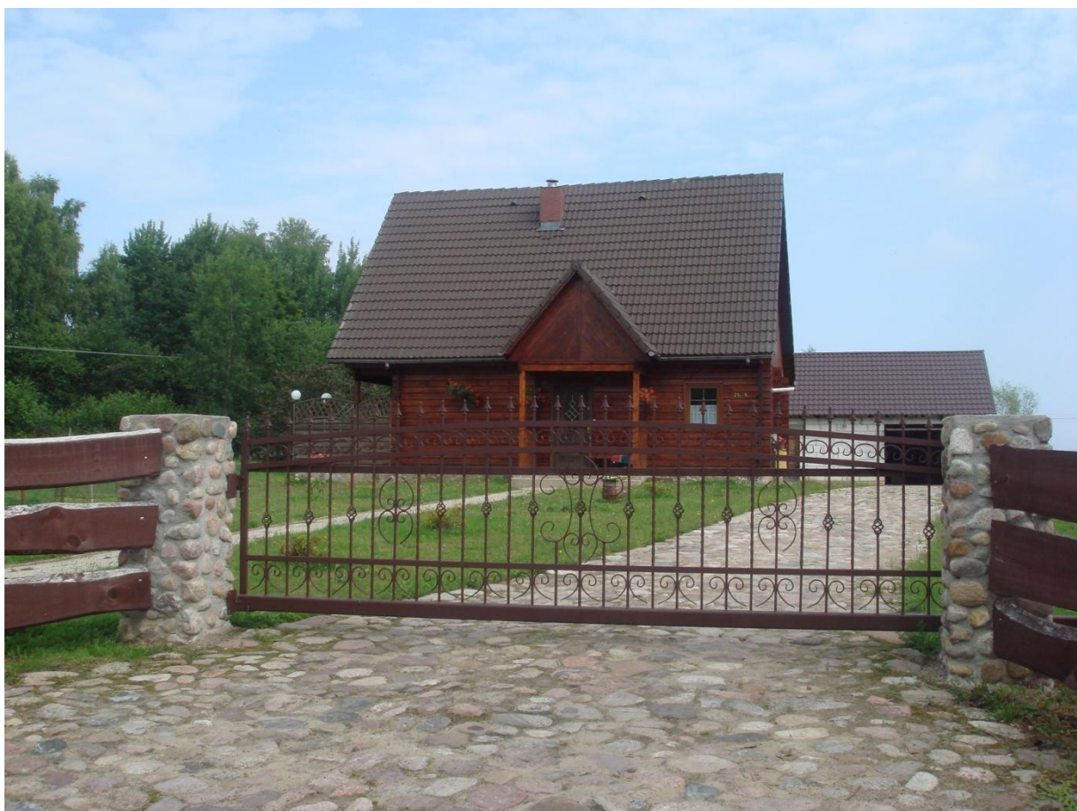
Fot. 13, 14, 15, 16,17,18. Potencjalne nieruchomości w miejscowości Zagozd z możliwością rozwoju agroturystyki