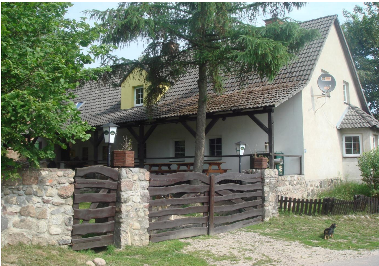
Fot. 11,12. Gospodarstwo agroturystyczne p. Kowalskiego w miejscowości Zagozd