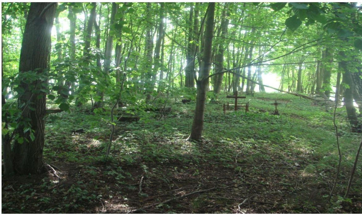
Fot.41,42. Poniemiecki cmentarz na terenie miejscowości Zagózd wnioskowany do rewitalizacji.

Uporządkowanie zabytkowych cmentarzy protestanckich pozwoli na poprawienie wizerunku wsi, także poprawi świadomość historyczną mieszkańców gminy. Odrestaurowane nekropole mogą służyć zarówno grupom dzieci i młodzieży realizującym zajęcia z zakresu historii regionalnej, jak i turystom indywidualnym.