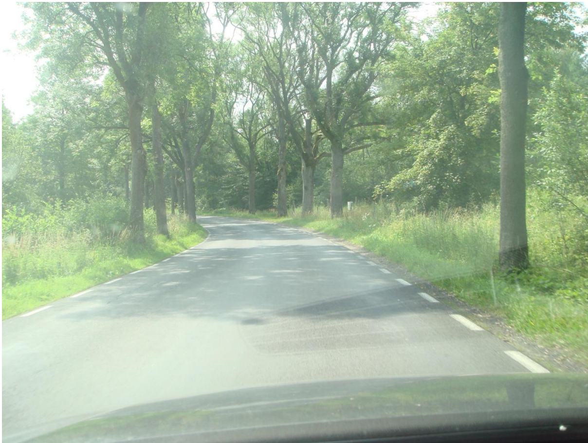
Fot. 20, 21, 22. Droga wojewódzka nr. 148 Łobez – Drawsko Pom. wnioskowany odcinek Zagózd – Gajewko pod budowę ciągu pieszego (prawa strona).

- ścieżka rowerowa z Gajewka do Drawska Pomorskiego,