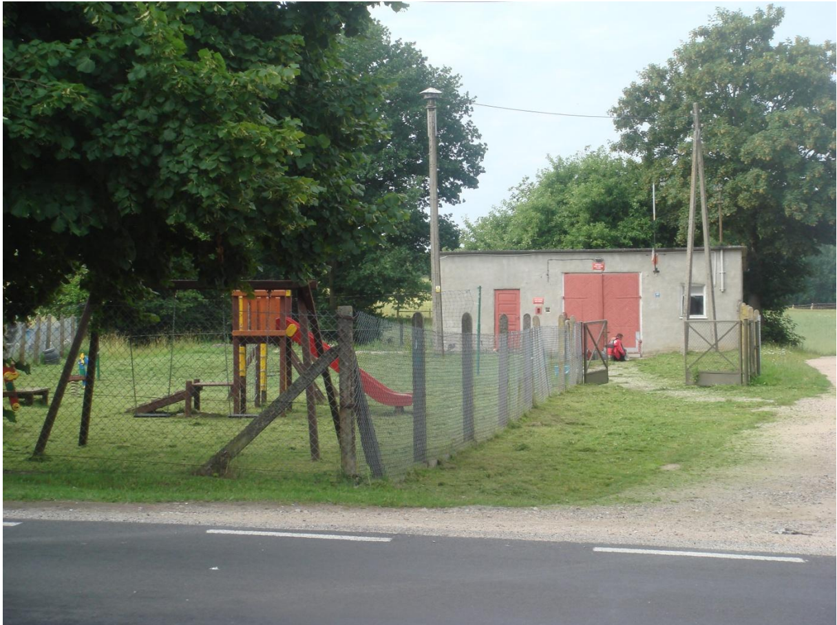
Fot. 34,35. Istniejąca remiza strażacka w miejscowości Zagozd wnioskowana do rozbudowy