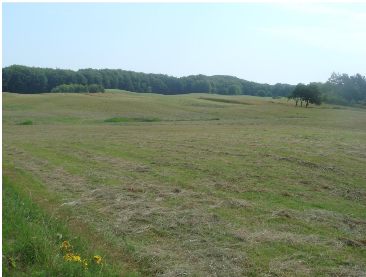
Fot. 19. Ekologiczna uprawa traw z mieszankami motylkowych drobnonasiennych na terenie miejscowości Zagozd.

Walory przyrodnicze Zagozdu i jego okolic, dobry stan środowiska naturalnego, brak przemysłu, niewielka gęstość zaludnienia, przemawiają za potrzebą traktowania turystyki, rekreacji, agroturystyki jako ważnych czynników aktywizacji gospodarczej. Szansą na powodzenie rozwoju Zagozdu jest również rolnictwo ekologiczne oraz stosowanie kodeksu dobrej praktyki rolniczej, która prowadzi do eliminowania niekorzystnych oddziaływań rolnictwa na środowisko, przede wszystkim niedopuszczalne do nadmiernej intensyfikacji i chemizacji produkcji rolnej. To również droga do produkcji wysokiej jakości żywności a także ochrona wód i gleb, jak i wprowadzenie dbałości o różnorodność biologiczną na terenach rolniczych i o walory krajobrazowe terenów wiejskich. Taki rozwój wymaga większego nakładu pracy ludzi niż w rolnictwie intensywnym, jest to więc możliwość tworzenia nowych miejsc pracy.