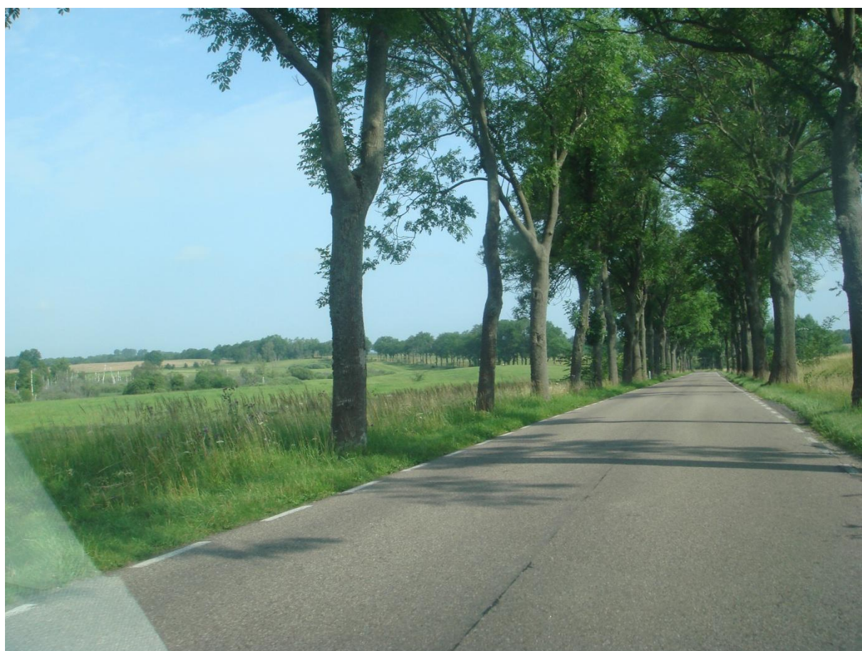
Fot. 23, 24, 25, 26, 27, 28, 29. Droga wojewódzka 148 Łobez – Drawsko Pom. – odcinek drogi Drawsko- Gajewko –wnioskowana budowa ścieżki rowerowej (lewa stron