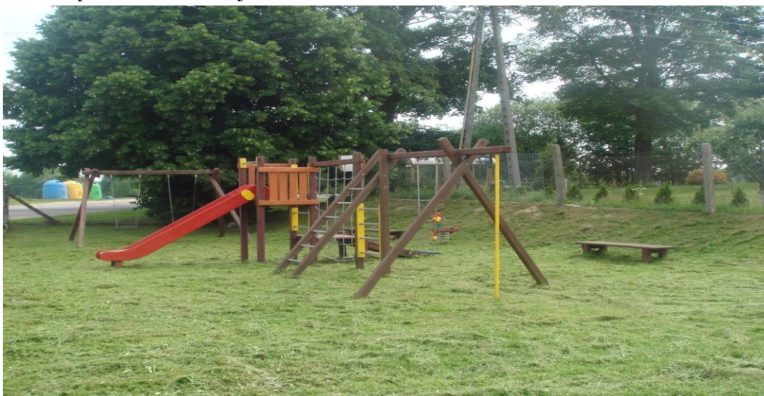
Fot. 31,32. Istniejący plac zabaw w miejscowości Zagozd.