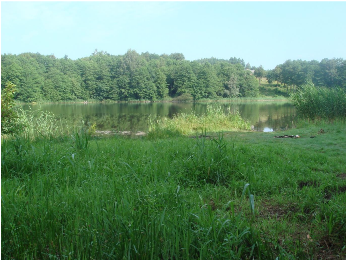
Fot. 43,44,45. Teren przyległy do jeziora Dolgie wnioskowany na utworzenie plaży.