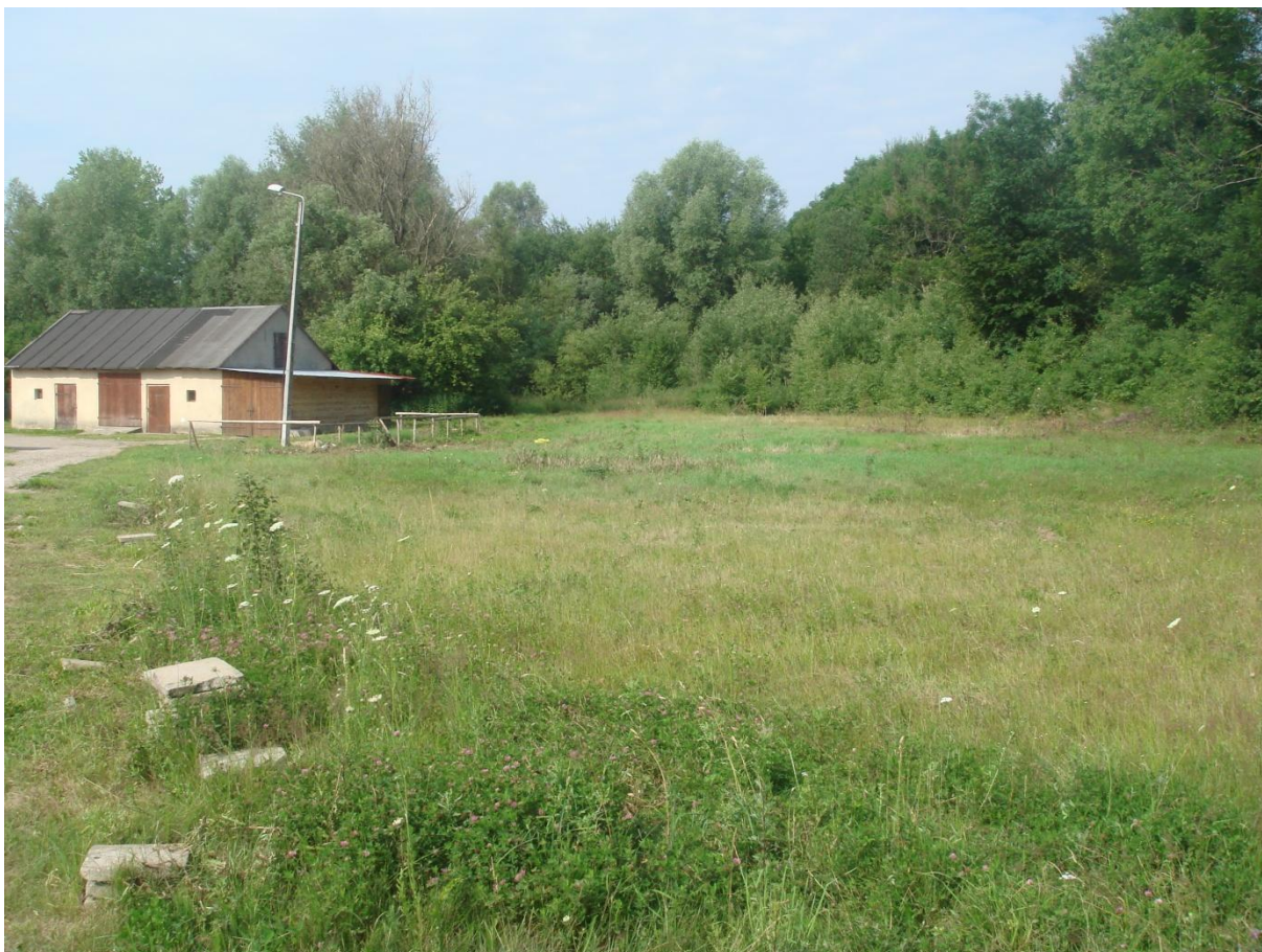
Fot. 33. Wnioskowane miejsce do zagospodarowania na plac zabaw w miejscowości Gajewko.