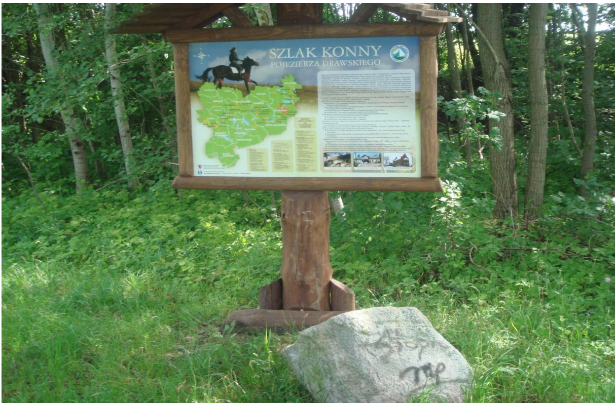
Fot. 39,40. Odcinek szlaku konnego prowadzący przez miejscowość Zagózd.